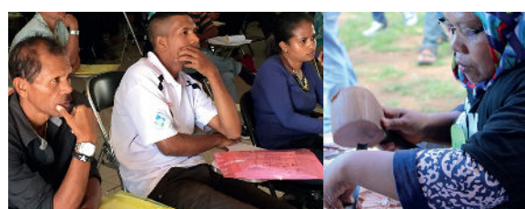
Lifelong learning in transformation: Promising practices in Southeast Asia

The other four countries, the Philippines, Thailand, Timor-Leste and Vietnam, have been finalising their concept notes and the policy forums in these countries are expected to be organised in the second quarter of the year 2018 .